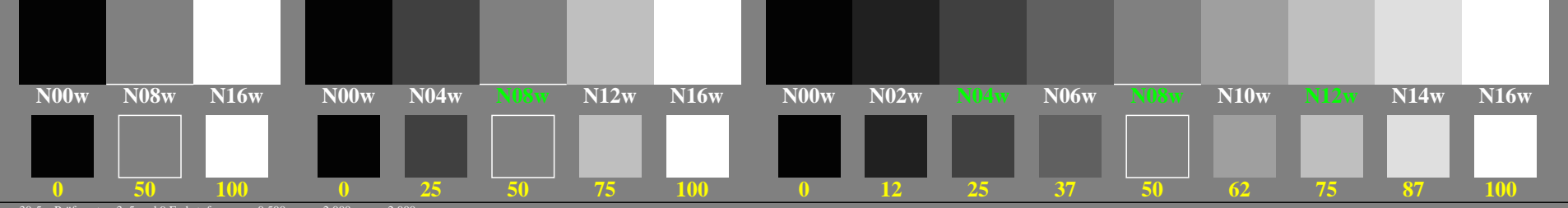
ggo30-5n, Prüfmuster: 3, 5 und 9 Farbstufen, greu=0,500, expu=2,000, expa=2,000

Drei, 5 und 9 Farbstufen für visuelle Beurteilung L^*_{TUBLOG,U} = 50 \log(Y / 5Y_U) + 50, Y_N=4, Y_U=20, Y_W=100 0, 15, 62, 140, 250, 390, 562, 765, 1000 Schwarz N00w – Schwarz N16w = Weiß W