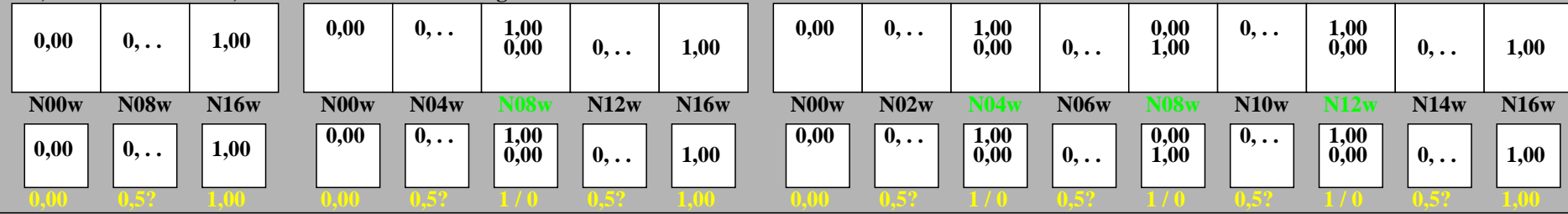
ggl50-3n, Prüfmuster: 3, 5 und 9 Farbstufen, greu=0,500, expu=0,500, expa=0,500