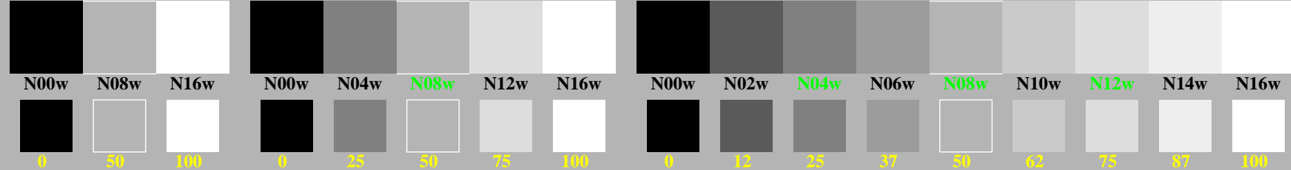
ggl50-1n, Prüfmuster: 3, 5 und 9 Farbstufen, greu=0,500, expu=0,500, expa=0,500