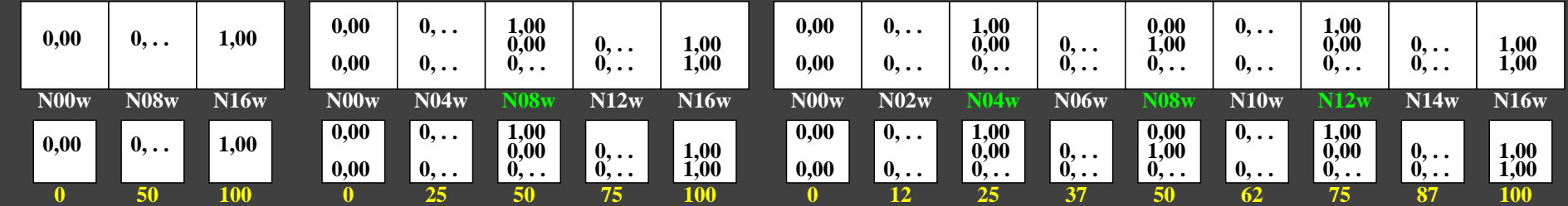
ggl40-5n, Prüfmuster: 3, 5 und 9 Farbstufen, greu=0,500, expu=2,000, expa=2,000

0, 15, 62, 140, 250, 390, 562, 765, 1000 Schwarz N00w – Schwarz N16w = Weiß W L^*_{TUBLOG,U} = 50 \log(Y / 5Y_U) + 50, Y_N=4, Y_U=20, Y_W=100