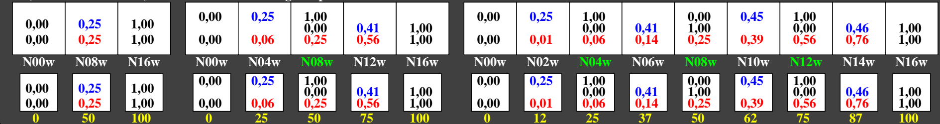
ggl40-7n, Prüfmuster: 3, 5 und 9 Farbstufen, greu=0,500, expu=2,000, expa=2,000

0, 15, 62, 140, 250, 390, 562, 765, 1000 Schwarz N00w – Schwarz N16w = Weiß W L^*_{TUBLOG,U} = 50 \log(Y / 5Y_U) + 50, Y_N=4, Y_U=20, Y_W=100