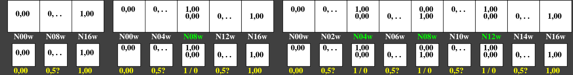
ggl40-3n, Prüfmuster: 3, 5 und 9 Farbstufen, greu=0,500, expu=2,000, expa=2,000

0, 15, 62, 140, 250, 390, 562, 765, 1000 Schwarz N00w – Schwarz N16w = Weiß W L^*_{TUBLOG,U} = 50 \log(Y / 5Y_U) + 50, Y_N=4, Y_U=20, Y_W=100