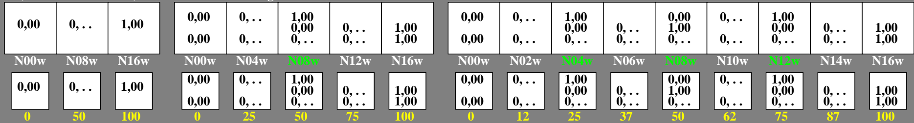
gg100-5n, Prüfmuster: 3, 5 und 9 Farbstufen, greu=0.500, expu=1.000, expa=1.000