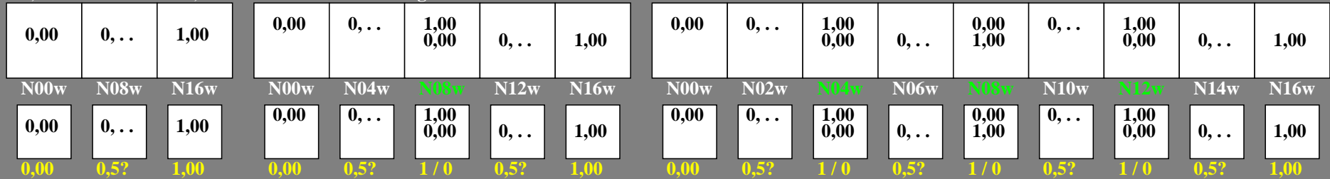
gg100-3n, Prüfmuster: 3, 5 und 9 Farbstufen, greu=0.500, expu=1.000, expa=1.000