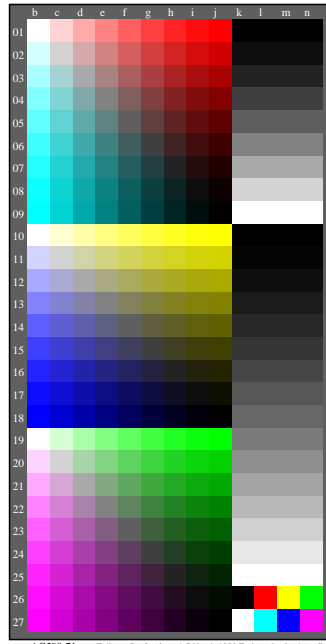
AG590-71 Teil von Prüfvorlage AG59 mit 1080 Farben; 9 oder 16stufige Farbskalen; Daten in Spalte (b-n): rgb 0-100110-L0 cmy6*

Unterscheidbarkeit von chromatischen Farben Anmerkungen: Dieser Test benutzt viele Farbskalen von 9 Stufen Buntonbene Rot - Cyanblau (Reihen 01 bis 09, Spalten b bis j) Unterscheidbarkeit von 81 chromatischen Farben Sind alle 81 Farben verschieden? Ja/Nein Nur bei "Nein": Wie viele sind verschieden? Von den 81 sind ..... verschieden. Buntonbene Gelb - Blau (Reihen 10 bis 18, Spalten b bis j) Unterscheidbarkeit von 81 chromatischen Farben Sind alle 81 Farben verschieden? Ja/Nein Nur bei "Nein": Wie viele sind verschieden? Von den 81 sind ..... verschieden. Buntonbene Grün - Magentarot (Reihen 19 bis 27, Spalten b bis j) Unterscheidbarkeit von 81 chromatischen Farben Sind alle 81 Farben verschieden? Ja/Nein Nur bei "Nein": Wie viele sind verschieden? Von den 81 sind ..... verschieden. Ergebnis: Von den 243 (=3x81) Farben sind ..... verschieden. Besonderheiten, bitte beschreiben falls sichtbar: ..... ..... Bemerkungen zur Erzeugung und dem Inhalt der PDF-Dateien: Manchmal ist "Farbglättung" die Voreinstellung. In diesem Fall sind 9 Stufen oft nicht sichtbar und können als eine Stufe gezählt werden. Manchmal ist "Optimierung der PDF-Ausgabe für das Web" die Voreinstellung. Zum Beispiel kann die Voreinstellung die 1080 Farben auf einer Seite auf 256 reduzieren.