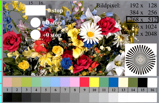
fgn10-7N, Bild B1-130-0: Blumenmotiv, 14 CIE-Prüffarben und 2+16 Graustufen (nI); PS-Operatoren settransfer, 3 colorimage

fgn10-7N, Seite 1/16, Prüfvorlage 2G mit 40x27=1080 Farben; digital gleichabständige 9 oder 16stufige Farbreihen; Farbdaten in Spalte (A-n): rgb^*(A_n) , colorm = 1 , xchart = 0 , pchart = 0