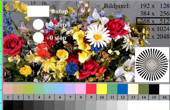
fgn10-7N, Bild B1-130-0: Blumenmotiv, 14 CIE-Prüffarben und 2+16 Graustufen (nI); PS-Operatoren settransfer, 3 colorimage

fgn10-7N, Seite 1/16, Prüfvorlage 2G mit 40x27=1080 Farben; digital gleichabständige 9 oder 16stufige Farbreihen; Farbdaten in Spalte (A-n): rgb^*(A_n) , colorm = 1 , xchart = 0 , pchart = 0