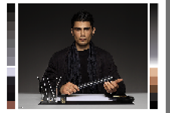
fgl5-7N, Dunkles HDR-Bild von Berliner Hochschule fuer Technik, Prof. Suess; PS-Operatoren settransfer, 3 colorimage

fgl50-7N, Seite 1/16, Prüfvorlage 2G mit 40x27=1080 Farben; digital gleichabständige 9 oder 16stufige Farbreihen; Farbdaten in Spalte (A-n): rgb^* (A_n) , colorm = 1, xchart = 0, pchart = 0