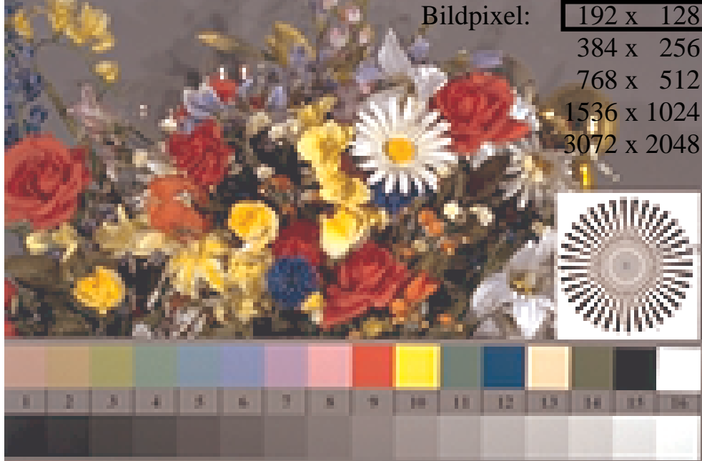
Bild B1: Blumenmotiv, 14 CIE-Prüfbarben sowie 2 + 16 Graustufen (sf); PS-Operatoren settransfer , 4 colorimage

Bildpixel: 192 x 128 384 x 256 768 x 512 1536 x 1024 3072 x 2048