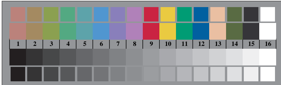
Bild B3: 14 CIE-Prüfbarben sowie 2 + 16 Graustufen; PS-operator cmY0*/000n* setcmykcolor

Fig. B1 bis B7; ISO/IEC-Prüfvorlage 2; ISO/IEC 15775 und input: cmY0*/000n* setcmykcolor DIS ISO/IEC 19839-X; output: Startup (S) data dependend